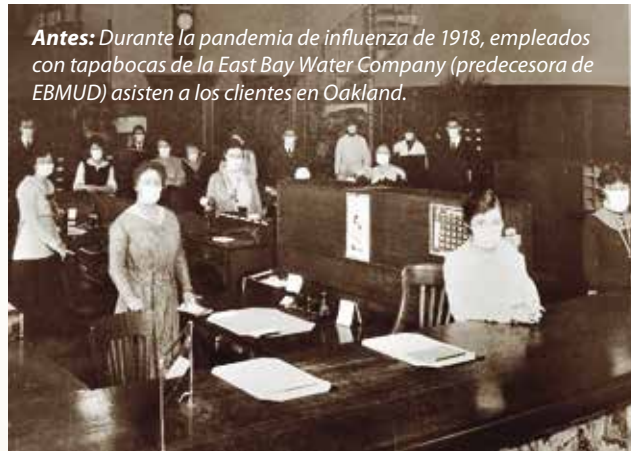
Antes: Durante la pandemia de influenza de 1918, empleados con tapabocas de la East Bay Water Company (predecesora de EBMUD) asisten a los clientes en Oakland.

Estamos orgullosos de nuestra trayectoria. A lo largo de días buenos y días malos, usted puede contar con que los trabajadores de EBMUD están a la vanguardia brindando el vital servicio de agua y aguas residuales.